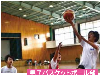
男子バスケットボール部