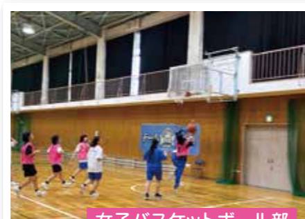
女子バスケットボール部