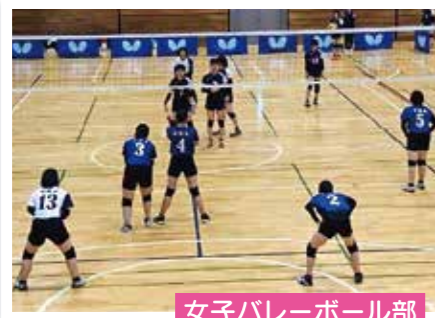
女子バレーボール部