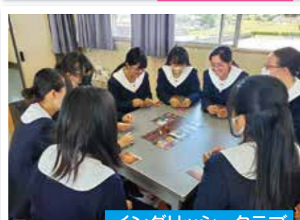
イングリッシュクラブ